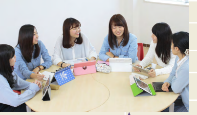
課題探求II 授業風景