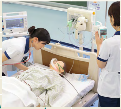
ケアリング コミュニケーション 授業風景